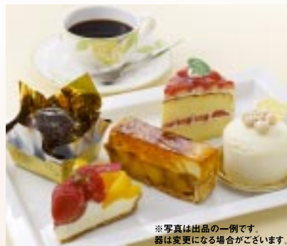
※写真は出品の一例です。 器は変更になる場合がございます。